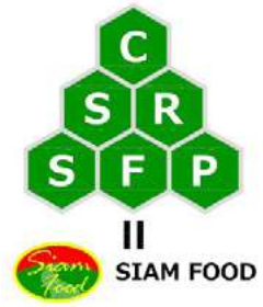
นายเกรม แอนโทนี่ ค็อกซ์

บริษัทดำเนินธุรกิจบนพื้นฐานหลักการของ CSR (Corporate Social Responsibility) ในการทำให้เกิดความสมดุลอย่างยั่งยืนของเศรษฐกิจ สังคม และสิ่งแวดล้อม โปรแกรม CSR ของบริษัท เริ่มดำเนินการมาตั้งแต่ปี 2554 และพนักงานทุกคนต้องปฏิบัติตามหลักจรรยาบรรณ (Code Of Conduct) เราเชื่อมั่นว่าการปฏิบัติตามหลักการเหล่านี้จะทำให้ธุรกิจของบริษัทดำเนินต่อไปได้อย่างยั่งยืนและเติบโตได้ในระยะยาว